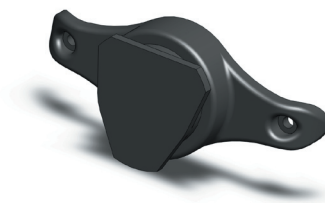
Úchyt radiostanice zkonstruovaný přesně na míru konkrétnímu projektu v 3D CAD řešení SolidWorks